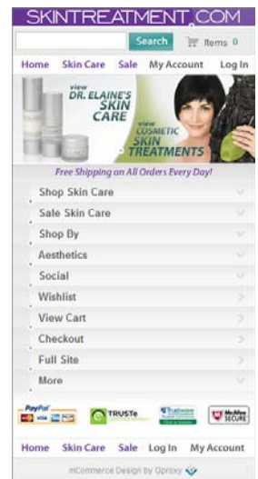
NetSuite Ecommerce vereinheitlicht Ihre Vertriebskanäle, egal ob Kunden über soziale Netzwerke wie Facebook oder über ihre Mobiltelefone einkaufen.